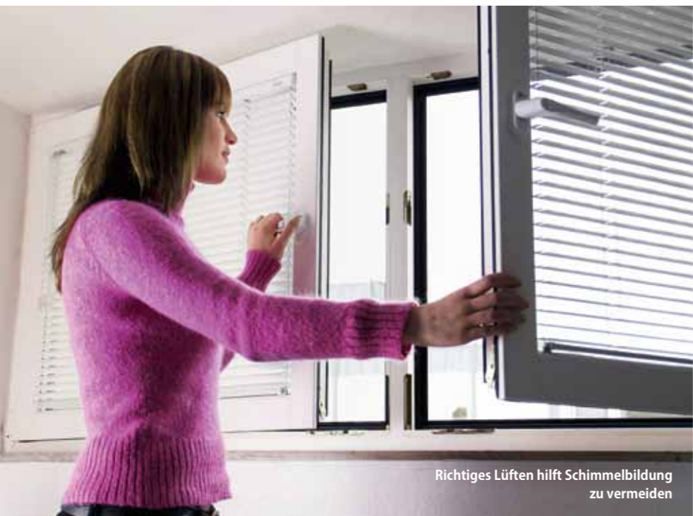
Richtiges Lüften hilft Schimmelbildung zu vermeiden

unabhängig und auf eigene Rechnung. Und es ist auch nur ein Angebot an die Kunden. Wer sich von einem anderen Baubiologen oder Inneneinrichter seiner Wahl beraten lassen möchte, kann dies gerne tun.