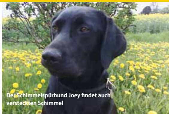
Der Schimmelspürhund Joey findet auch versteckten Schimmel

Ein Schimmelspürhund ist ähnlich ausgebildet ist wie ein Drogenspürhund. Mit seiner sensiblen Nase nimmt er bereits feinste Geruchsstoffe des Schimmels auch hinter Tapeten oder Schrankwänden oder unter dem Bodenbelag wahr und zeigt Befall an, indem er sich hinlegt. Der Hund sucht ohne Vorbereitung und der Kunde erhält sofort das Ergebnis