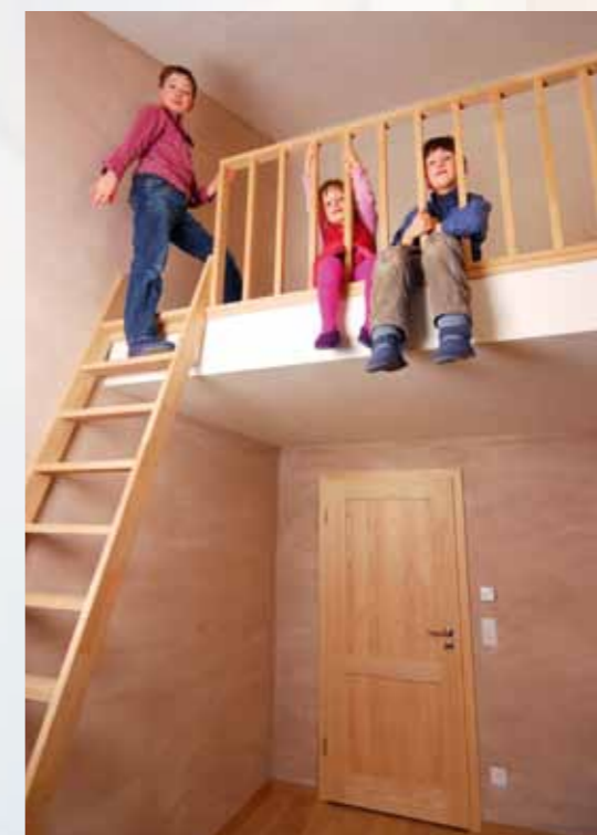
Dank des raumluftaktiven (natureplus-zertifiziertes Kalkputzsystems von Knauf Marmorit) können die stark allergiegeplagten Familienmitglieder wieder aufatmen